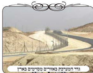
גדר המערכת באזורים מסוימים בארץ

נושא מעניין שעולה מידי פעם ע"י השואלים, וע"י חוקרים שונים, האם אפשר לעשות עירוב לארץ ישראל ע"י גדר המערכת וגדר הגבולות המקיפות את ארץ ישראל, מכל אויביה המקיפים אותה, וטענת השואלים שגדר זו היא בודאי טובה וחזקה, ואין חשש שיהיו בה פרוצות, כי אחרת ה מסוכן לביטחון הארץ, א"כ אפשר לומר בודאי שכל ארץ ישראל היא רשות היחיד גמורה. והנה ודאי שזה לא יועיל לפטור מלעשות עירובים לכל עיר ועיר, מפני שהגדרות האלו כוללת שדות והרים שפוסלים את העירוב, [והגדר אינה חומת עיר מסוימת, שגם את ההיתר של הדבר שמואל שכל שבתוך החומה מיועד לשימוש לדירה, לא שייך בגדר זו]. אלא הרעיון היה על מנת לבטל דין רשות הרבים דאורייתא, מפני שמקום שמוקף בג' מחיצות, אינו רשות הרבים, וא"כ יהיה אפשר לעשות את עירובי הערים ללא חשש רה"ר, גם לדעת מרן המחבר.