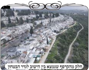
חלק מהקירוף שנמצא בין הישוב לגדר הבטחון

אבל בעיר עמנואל הגדר מתוחזקת ברמה גבוהה מאוד, וגם האחראי עירתי לנעשה בה, ולכן היא משמשת את העירוב. אבל הבעיה היא שבין הגדר לישוב יש שטחים גדולים שאינם בנויים משמשים כלל, ואף עלה בהם קוצים וצמחיה קשה וגבוהה, שמונעת זמי שרועה לעבור ולהשתמש שם. [ועי' משי"כ לעיל גליון 195, בענין השימוש של חסידי ברסלב להתבודד בתוך אחד מהשטחים האלו, האם זה נחשב שימוש דיורים]. לכן האחראי מבקש כבר זמן רב לעשות עמודי עירוב סביב, ולהוציא את השטחים האלו מהעירוב.