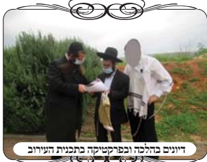
דיונים בהלכה ובפיקוח בתכנית העירוב

בשבוע זה נתבקשנו להגיע לעירוב של העיר עמנואל, היושבת בהרי השומרון, ובה גרים מאות משפחות חרדיות, בישוב זה העירוב מתבסס על הגדר הבטחונית שמקיפה את הישוב בהרבה ישובים שיש גדר