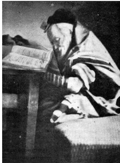
החפץ חיים בתפילה

[וכהמשך לכך, מספר רבינו, שבסוף ימיו התאונן פעם הרב זצ"ל בפני מרן הגר"ש רוזובסקי זצ"ל ובפני רבינו, ואמר "דער חפץ חיים האט אזיי פיל כוחות אריין געלייגט ביי מיר, און ס'איז גארנישט געווארין פון מיר", פי' החפץ חיים השקיע בי כ"כ הרבה כוחות, ולא נהיה ממני כלום... ואמר רבינו לרב "ס'איז דאך ארויס געקומן פוניבז'ע ישיבה..". הרי יצא מזה ישיבת פוניבז', ונרגע בזה הרב מעט].