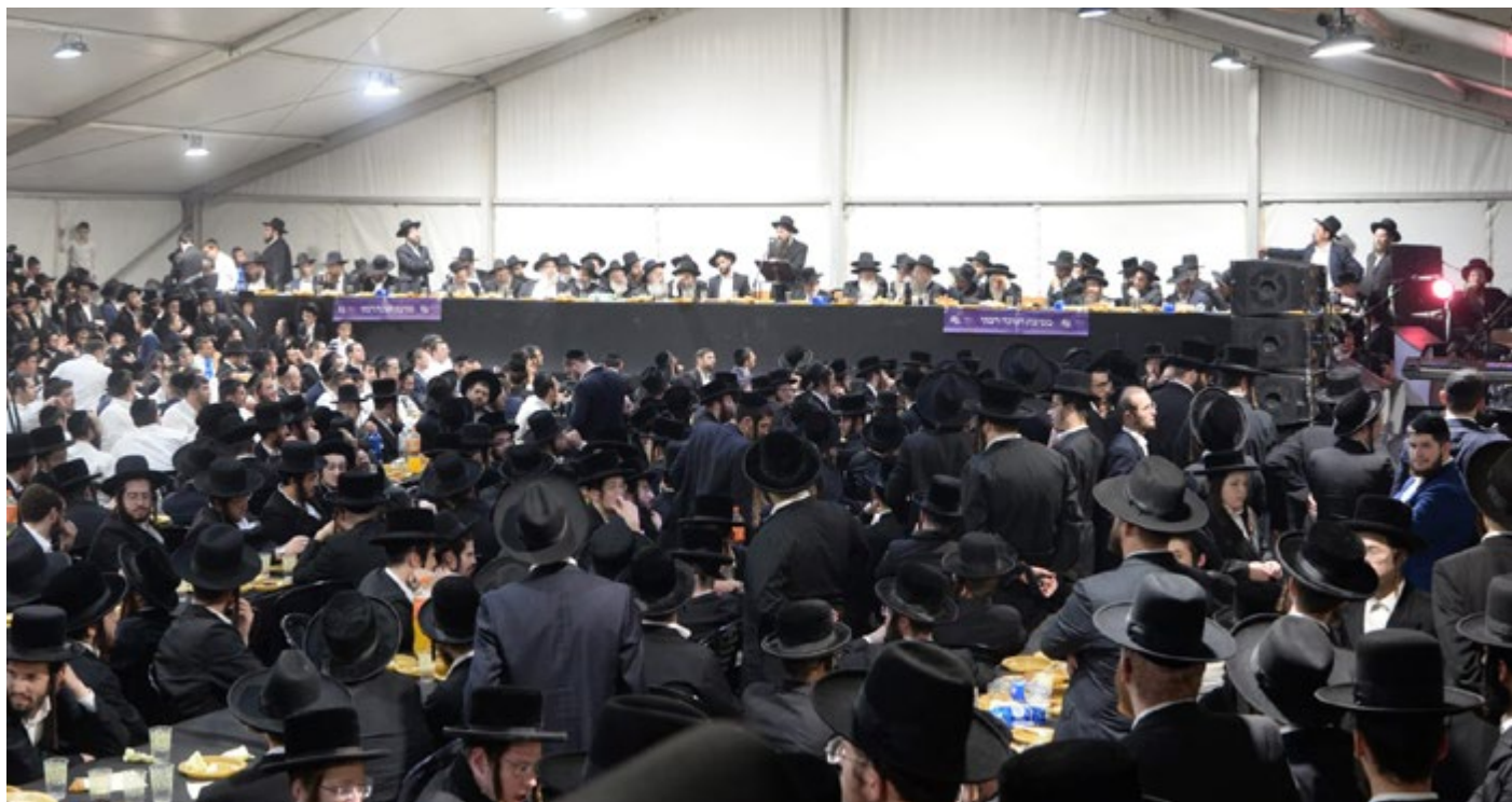
"כדי להודות ולהלל לשמך הגדול" המוני תלמידי הישיבה השתתפו השבוע במסיבת חנוכה מרוממת בראשות ובהשתתפות רבותינו מרנן ראשי ורבני הישיבה שליט"א