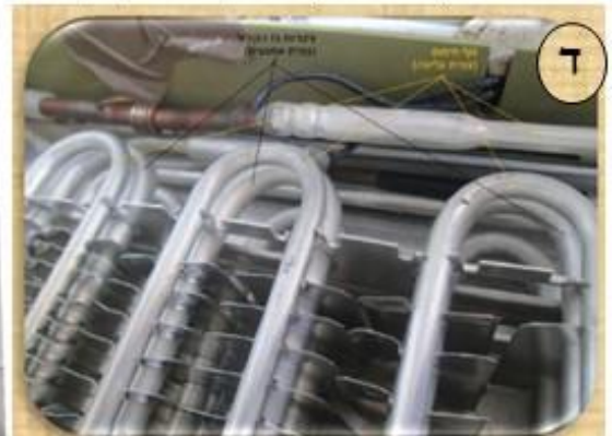
סוללת קירור עם גוף חימום