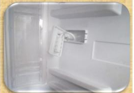
רגש טמפרטורה דיגיטלי במקרר