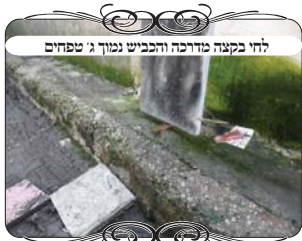
לחי בקצה מדרגה והכביש נמוך ג' טפחים

דין זה מבואר בדברי החזו"א (סי' ע' ס"ק ח') שהלחי אינו כשר, כי הוא כעין מחיצה תלויה. ואע"פ שאין חלל מתחת הלחי, הביאור בזה דכיון שאין על המדרגה רוחב ד' טפחים [בצד שלפני הלחי] כשיעור רשות, א"כ הקרקע של הרשות היא למטה, וא"כ צריך