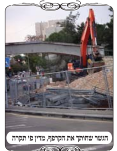
הגשר שחוצק את הקרפף, מדין פי תקרה

בסמוך להנ"ל יש עוד מתחם נוסף של העבודות והאחראי ביקש שנמדוד את גודלו, ולאחר מדידה וחישוב נמצא שיש בו מעט יותר מבית סאתיים, וא"כ גם בו יצטרך לשמור על הגדרות. אבל במתחם זה מצאנו היתר שאינו מצוי, ע"י הגשר שעובר מעליו, שבינתים לא הורסים אותו, והוא חוצה לרוחב המתחם וא"כ יש לומר בשפתו דין פי תקרה יורד וסותם, ונחשב כמחיצה באמצע המתחם, שמחלקת אותו לשנים, ואז בכל חלק אין שיעור בית סאתיים. פתרון זה מוזכר בשו"ע (סי' שנ"ח ס"ב) שאם יש שטח של שלש סאין, ועשה תקרה על בית סאה, הרי זה מחולק ע"י פי תקרה, וכולו מותר, כי כל חלק הוא פחות מבית סאתיים.