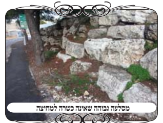
מסלעה גבוהה שאינה כשרה למחיצה

בצד אחר של מתחם זה, היה קטע באורך כמאה מטרים שלא היו גדרות, כיון שיש בו כעין קיר גבוה שני מטרים מסלעים גדולים [שיוצרים טרסות], והקבלנים שמכו על כך כסגירה למתחם. אבל לגבי מחיצה הלכתית הדבר אינו פשוט. בביאור הלכה (סי' שנ"ח ס"ב, וסי' שס"ב ס"ב ד"ה שעשה) האריך