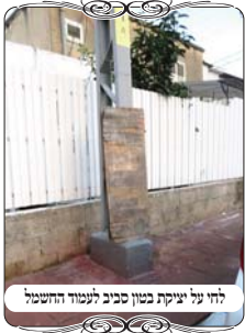
לחי על יציקת בטון סביב לעמוד החשמל