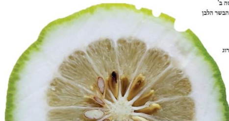
חסר לפי שיטה ג' נחסר מהבשר הלבן של האתרוג

ג. אתרוג החסר פסול ביום הראשון, וכשר בשאר הימים 8 , אולם כתבו הפוסקים שיש להדר אף בשאר הימים ליטול אתרוג שאינו חסר 9 .