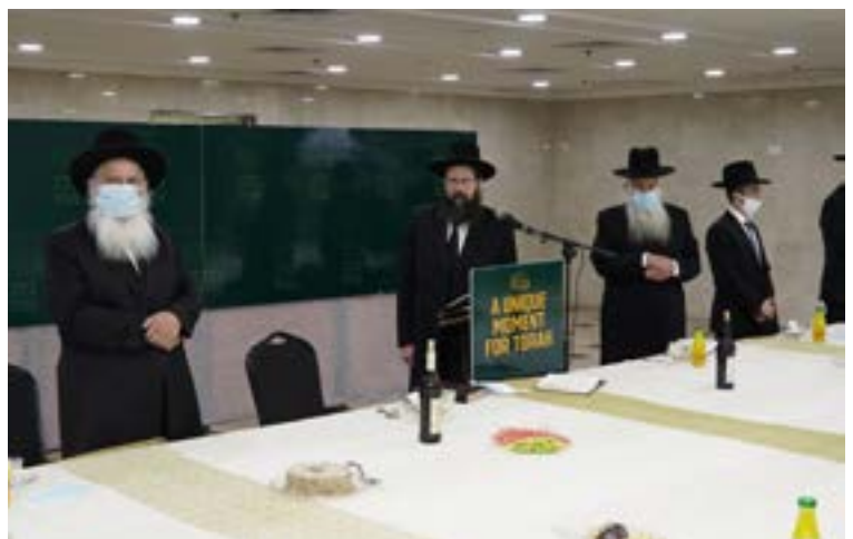
מורנו ראש הישיבה שליט"א מסיים את הש"ס 3 פעמים במעמד מיוחד לפנות בוקר בהשתתפות רבני הישיבה שליט"א, בשידור מיוחד לדינר השנתי שנערך בארה"ב לידידי תורמי הישיבה הק'.