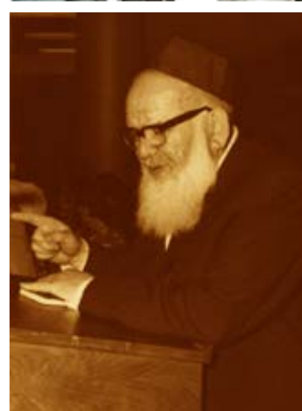
רבי אריה פינקל תשע"ו