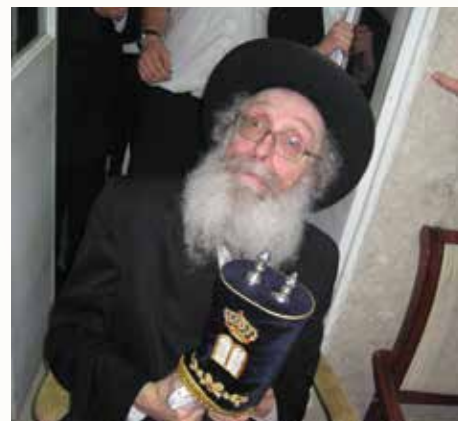
מרן רה"י הגאון הגדול רבי נתן צבי פינקל זצוק"ל בשמחת התורה עם ספר תורה בידו