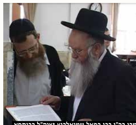
מרן רה"י רבי רפאל שמואלביץ זצוק"ל בריתחא דאורייתא בהיכל בית המדרש המרכזי עם יבדלחט"א הגאון הגדול רבי אשר אריאלי שליט"א