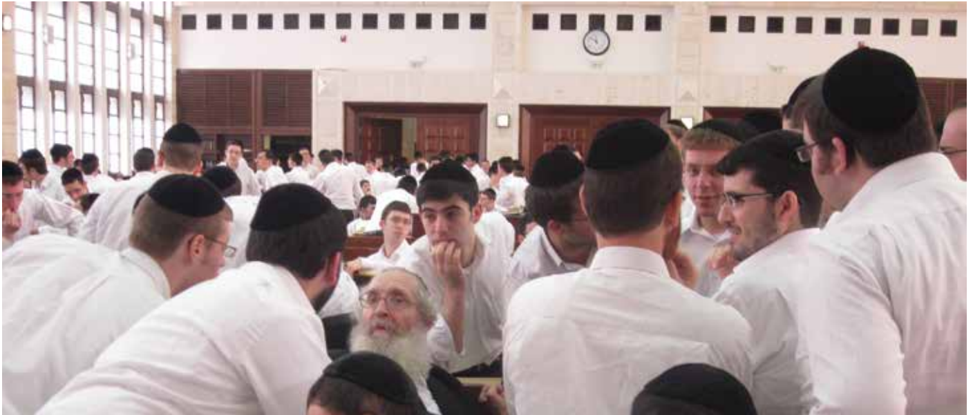
מרן רה"י נתן צבי פינקל משתעשע בדברי תורה עם התלמידים בהיכל הישיבה במודיעין עילית

כל חייו של מרן ראש הישיבה הגאון רבי נתן צבי פינקל זצוק"ל היו מקשה אחת של תורה, ללא הבדל בין תקופת "הזמן" לימי "בין הזמנים", שבת, חג וחופה"מ. בכל סוף "זמן" בשיבה, מיד לאחר השיעור האחרון על המסכת החל בלימוד המסכת של "זמן" הבא והיה ממשיך בכך ברציפות בכל ימי "בין