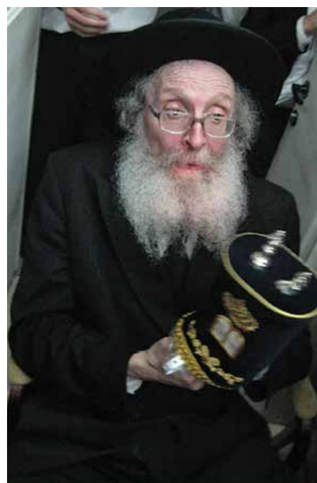
הגאון הגדול רבי נתן צבי פינקל זצוק"ל

בדומה לסיפור הזה, סיפרו כמה אנשים שכאשר ביקשו מהרב שיפעיל את השפעתו במקומות שונים, אם ראה שהוא אכן יכול לעזור, עשה זאת תיכף