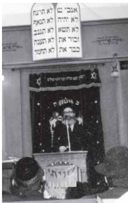
נושא דברים בהיכל הישיבה