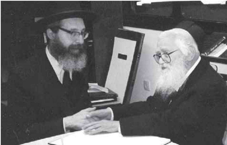
בסוד שיח עם רשכבה"ג מרן הגרא"מ שך זצוק"ל

אין ספור סיפורים מסופרים על אהבת התורה של רבינו. כך מעשה שהיה בעיצומו של שיעור יומי בפרק ב' דפסחים (דף כד, ב) בסוגיית 'היוצא מן התותים ומן הרימונים'. בדבריו דן אם מיץ רימונים הוא משקה. בחור שנכח בשיעור ושמע את השאלה העי: 'הלא פסוק מפורש הוא, שמיץ רימונים הוא משקה, כפי שנאמר "אשקיך מיין הרקח מעסיס רימוני"'. מששמע ראש הישיבה כך קם ונשקו על ראשו. לשאלתו מי הוא, השיב הבחור שבא להיבחן לשיבה. משמחתו הגדולה על הראיה שהביא, קבלו מיד בלא בחינה ובירורים.