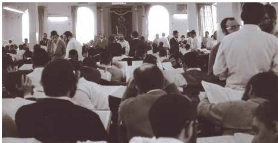
תמונה מהיכל בית המדרש מלפני קרוב לארבעים שנה. בצד שמאל ליד העמוד ניתן להבחין בדמותו של ראש הישיבה זצ"ל בשנים ההן

בשבתות היה מזמינו לסעודת את סעודת ליל שבת על שולחנו והיה תמיד מבקש ממנו שישמייע באוזניו 'שטיקל תורה' שהתחדש לו במהלך השבוע. בשבת בבוקר היה מתארח אצל מרן ראש הישיבה שר התורה הגאון רבי חיים שמואלביץ זצ"ל ושם היה צריך לומר 'שטיקל' נוסף. בני המשפחה תמחו באוזני הגרא"י "הלא הוא לומד טוב, ומדוע כבר תובעים ממנו שיאמר 'שטיקלאך תורה' בקביעות?!" אולם הוא לא קיבל את דעתם והמשיך לתבוע ממנו לחדש. וכשהיה מאזין לדבריו היה תמיד מביע באוזניו את התפעלותו מחידושו, אולם יחד עם זה היה מכוון את הלך מחשבתו, מתקן ומוסיף